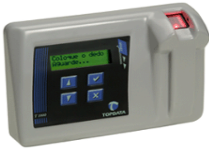
El T2-T1000 Bio